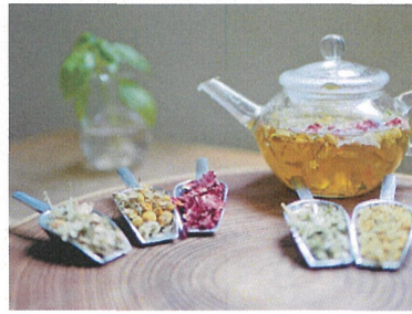
花や葉が開く様子や香りを感じて 「マインドフルネス」

マインドフルネスとは、過去の経験や先入観といった雑念に捉われることなく、今この瞬間の身体や気持ちに意識を向け、受け入れる状態のことをいい、集中力やストレス耐性が高まると言われています。 アメリカの国立科学財団の研究によると、私たちは、一日に約6万回思考し、その多くは同じことの繰り返しで、8割がネガティブな内容だといわれています。無意識のうち過去の後悔や未来への不安に思考が飛んでいること、ありますよね！これに気づいたら、目の前のモノの様子や香りを観察して「マインドフルネス」をお勧めです。